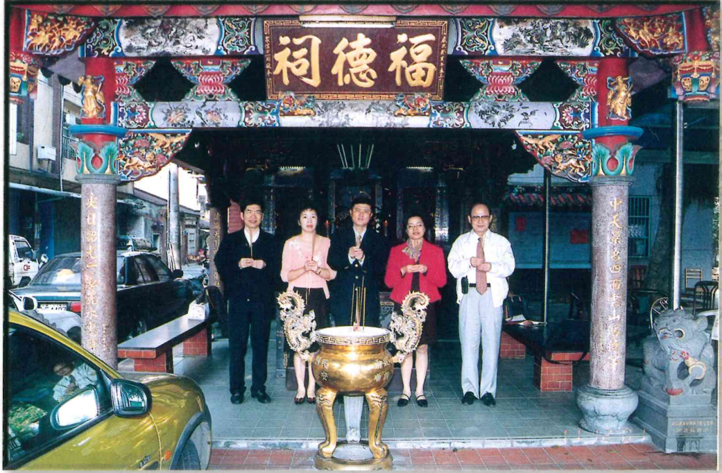
會館落成吉日理事長祈求全體會員鴻圖大展