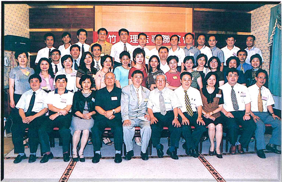
桃竹苗理監事聯誼會-地政、業界一家親