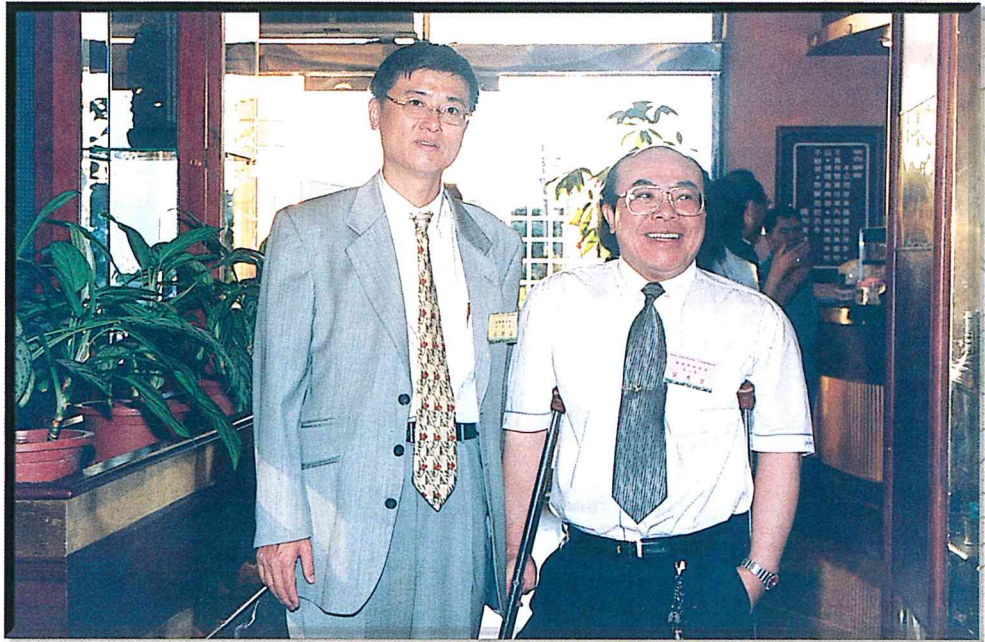
理事長及敬愛的地政局長