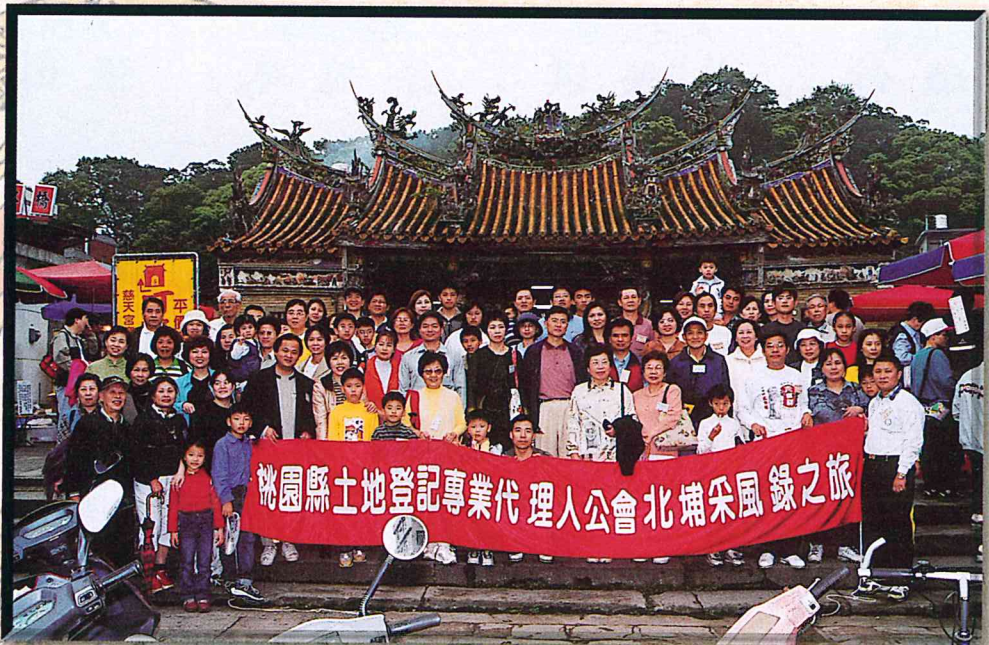
自強活動-北埔采風錄之旅