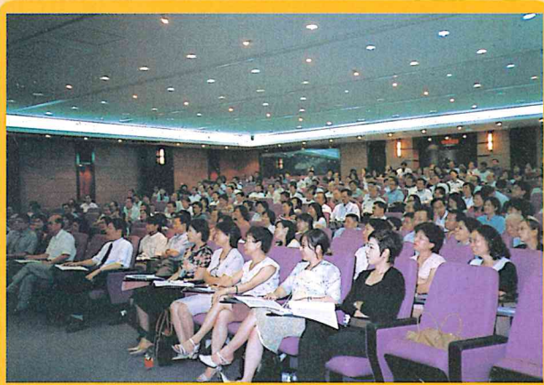
學術講座假歷新醫院「國際會議廳」十二樓舉辦