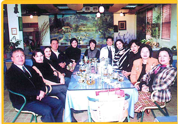
假富田花園農場開第六屆學術委員會第十三次 會議92/12/18