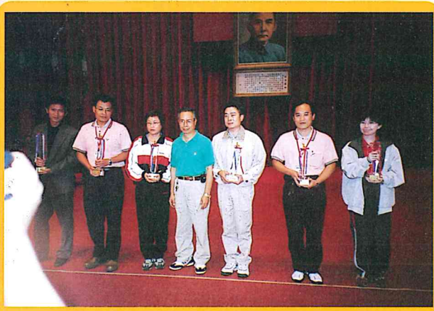
參加第二十三屆地政盃競賽歌唱比賽獲得第二名及第五名92/10/23-92/10/24