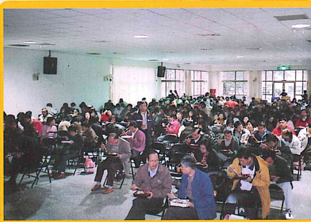
舉辦學術專題講座，會員用餐盛況92/11/29