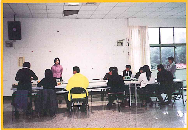
假平鎮市婦幼活動中心一樓舉辦第七屆會員 代表選舉開票作業92/12/10