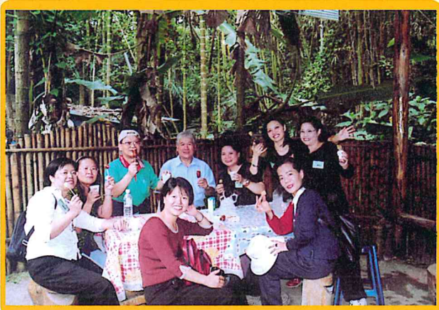
舉辦達娜依谷風情之旅二日遊自強活動 92/11/15-92/11/26