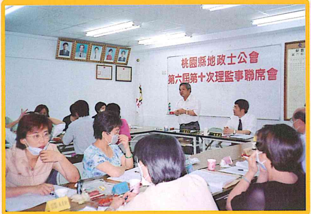
SARS期間在公會舉行第六屆第十次理監事聯席會 92/05/30