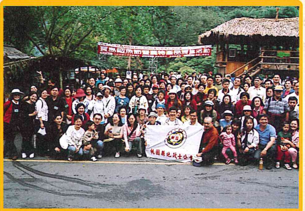
舉辦達娜伊谷風情之旅二日遊自強活動 92/11/15-92/11/16