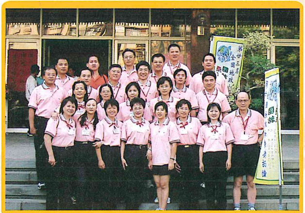
參加第二十三屆地政盃競賽人員 92/10/23-92/10/24