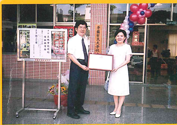
聘平鎮市市長李月琴為桃園縣地政士公會顧問 92/05/30