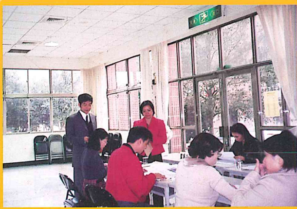
假平鎮市婦幼活動中心一樓舉辦第七屆會員 代表選舉開票作業92/12/10