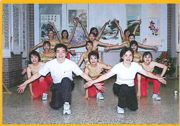
參加第二十三屆，地政盃晚會表演人員 92/10/23-92/10/24