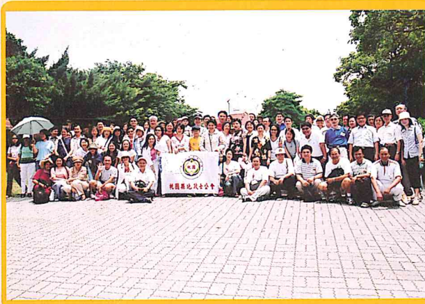
舉辦飛牛牧場，西濱海洋生態教育館一日遊 自強活動92/08/09