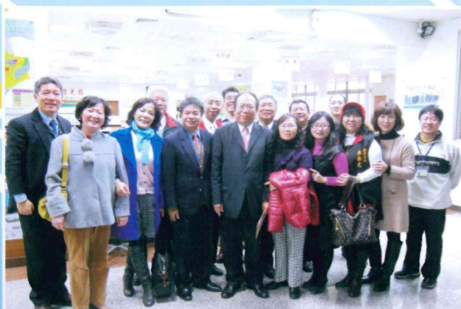
拜會桃園縣八德地政事務所 101. 1. 31