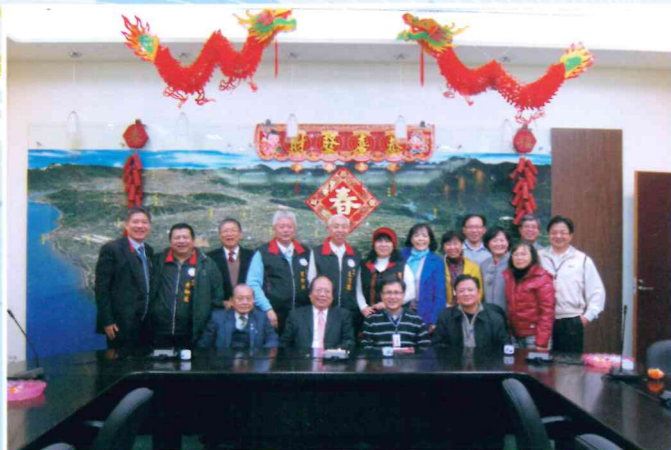
拜會桃園縣楊梅地政事務所 101. 1. 31