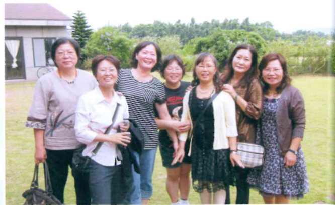
100年度桃竹苗四縣市理監事暨本會主、副主委及委員聯誼會 100.9.2