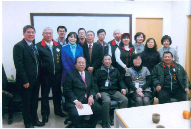
拜會桃園縣桃園地政事務所 101. 1. 31