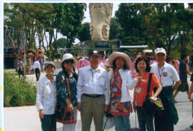
100年度新加坡・馬來西亞全覽5日遊 100. 4. 7-11