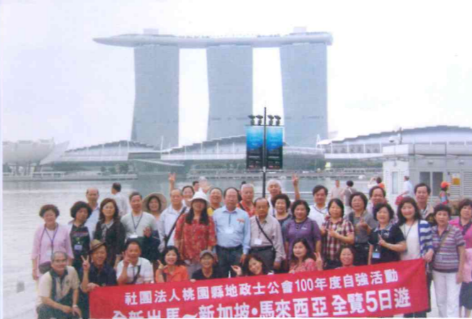
100年度新加坡・馬來西亞全覽5日遊 100. 4. 7-11