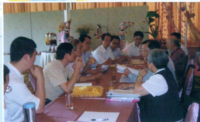
權益委員會~會務會議 100.6.14