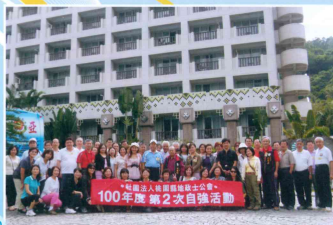
台東、高雄、台南大坑休閒農莊三日遊 100. 10. 21-23