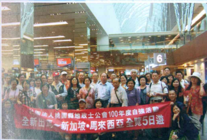
100年度新加坡・馬來西亞全覽5日遊 100. 4. 7-11