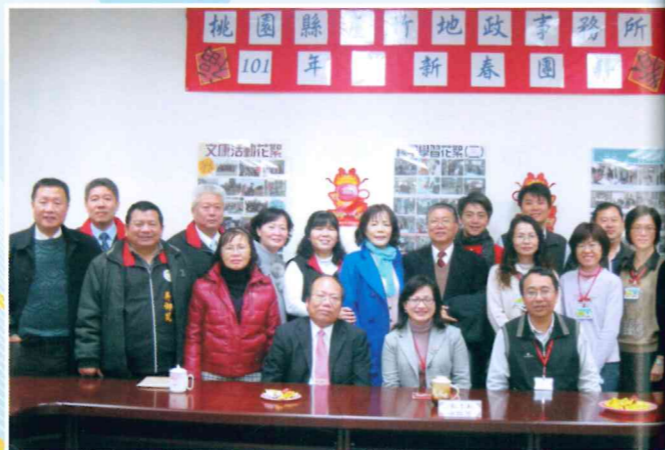
拜會桃園縣蘆竹地政事務所 101. 1. 31