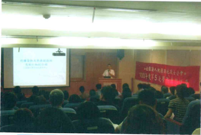
100年度第5次學術講座 100.7.20