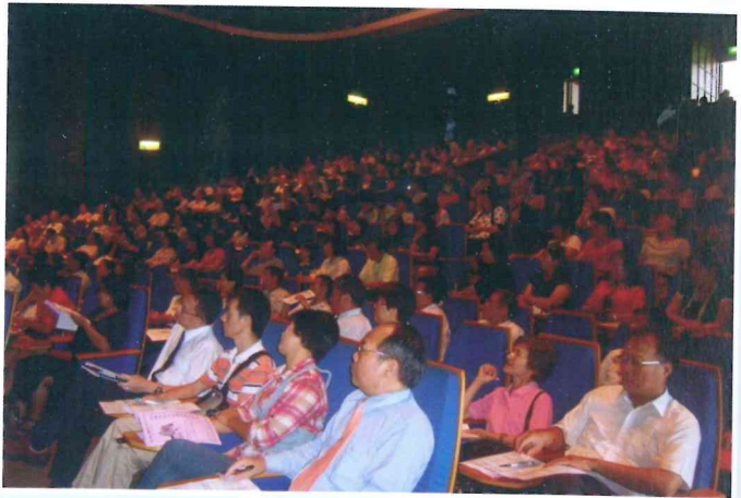
100年度第3、4次學術講座 100.6.9