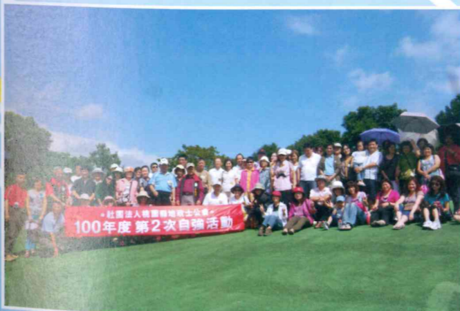
台東、高雄、台南大坑休閒農莊三日遊 100. 10. 21-23