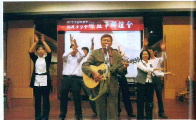
100年度桃竹苗四縣市理監事暨本會主、副主委及委員聯誼會 100.9.2