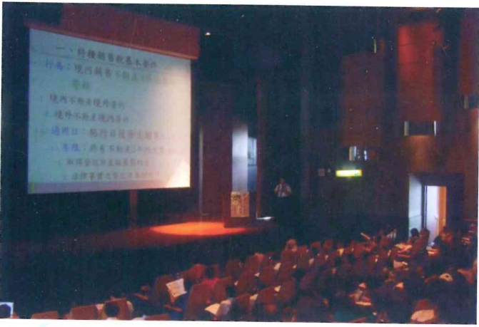
100年度第3、4次學術講座 100.6.9