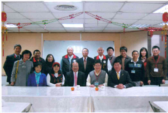
拜會桃園縣中壢地政事務所 101. 1. 31