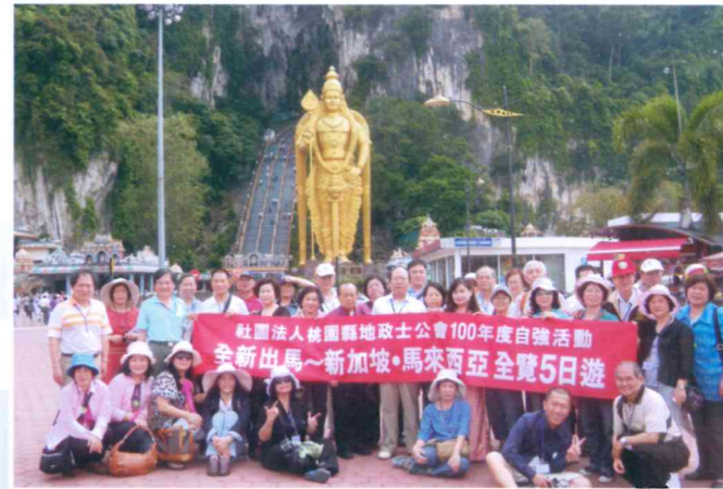
100年度新加坡・馬來西亞全覽5日遊 100. 4. 7-11