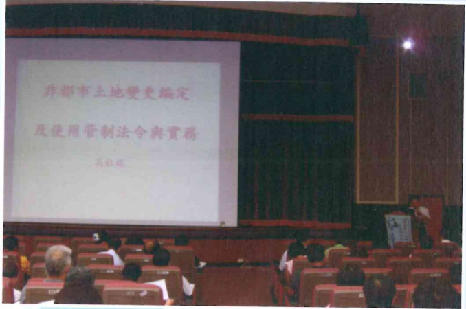
100年度第6次學術講座 100.8.19