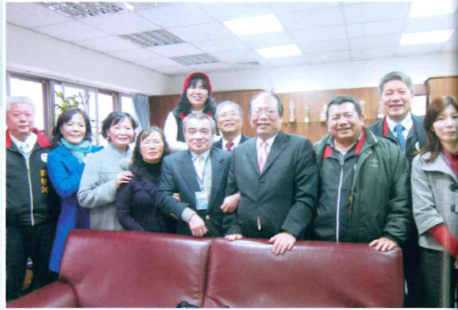
拜會桃園縣大溪地政事務所 101. 1. 31