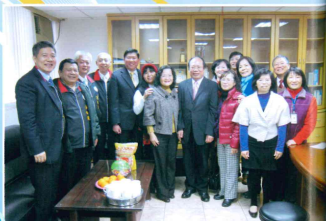
拜會桃園縣平鎮地政事務所 101. 1. 31