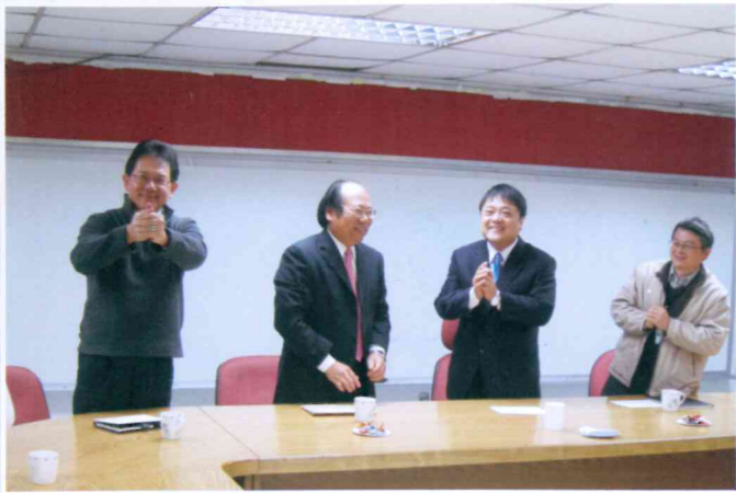
拜會桃園縣政府地政局 101. 1. 31