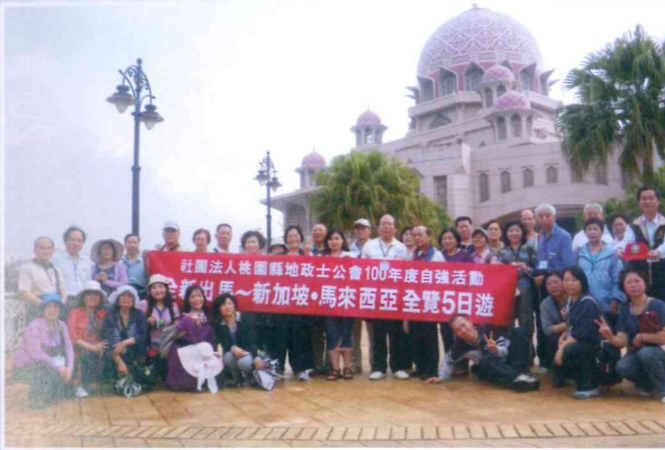
100年度新加坡・馬來西亞全覽5日遊 100. 4. 7-11