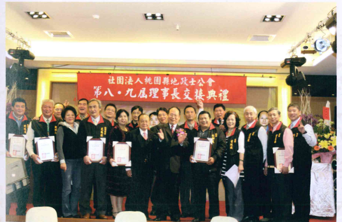
第九屆全體理監事合照