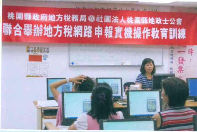
地方稅網路申報實機操作教育訓練課程 100.7.21