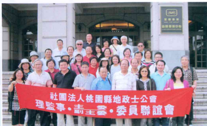
100年度第1次理監事、主副主委及委員聯誼會 「宜蘭~棲蘭森林遊樂區及礁溪泡湯」一日遊 100.5.20