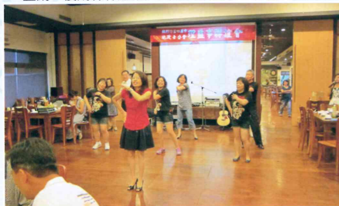
100年度桃竹苗四縣市理監事暨本會主、副主委及委員聯誼會 100.9.2