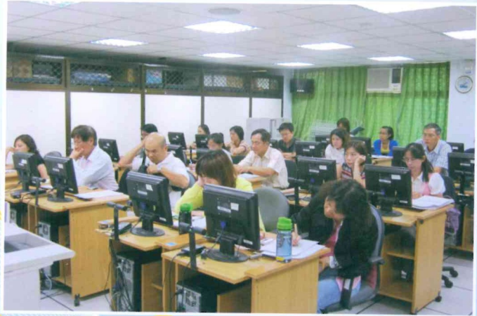
地方稅網路申報實機操作教育訓練課程 100.9.16