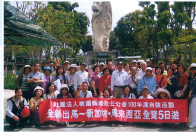
100年度新加坡・馬來西亞全覽5日遊 100. 4. 7-11